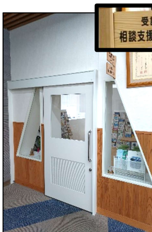
福祉会館1階 矢印の部屋が「こだま」です