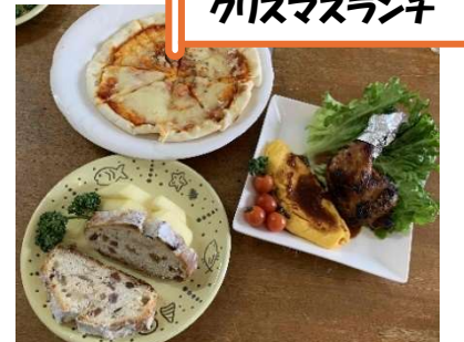
クリスマスランチ