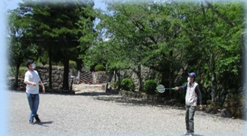
ほにわ館・図書館・松坂城へ行きました☺