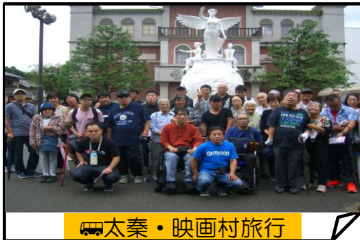
🚗太秦・映画村旅行