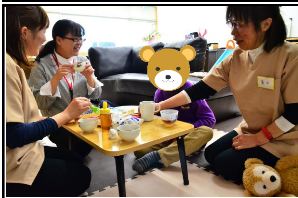
職員とおやつ作り! 毎日15時頃