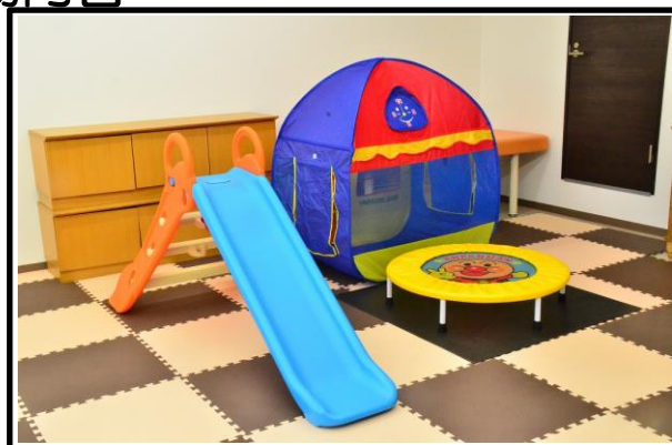
エンジョイスペース