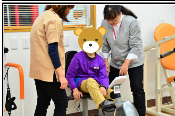
運動機器でお遊りリハビリ!