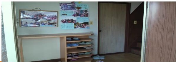
玄関（上 第一・下 第二）