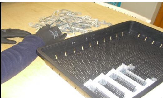
🔩 プレート金具入れ