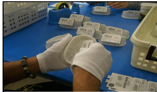
🔧 プラスチック作業