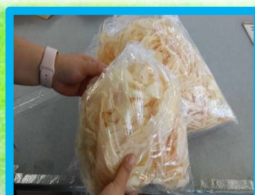
カンナくず緩衝材作り