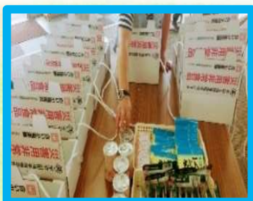
非常備蓄品の箱詰め