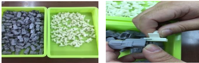
作業マニュアル仕様書も分かりや